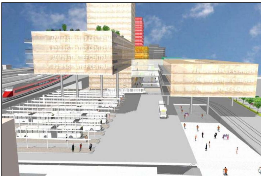
La future connexion train-tram-bus à Gand-Saint-Pierre.