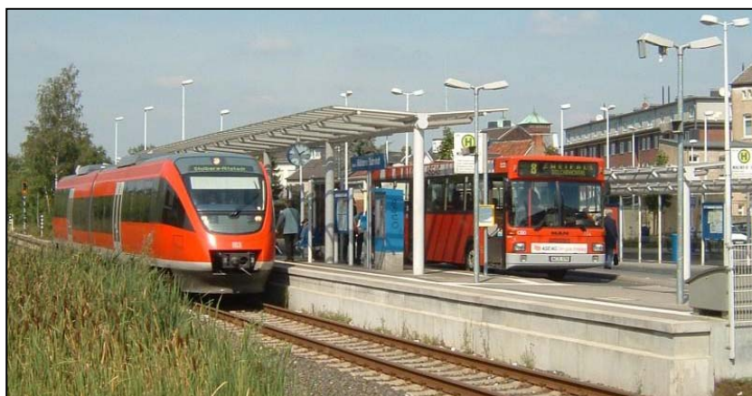
La connexion train-bus à Stolberg (Allemagne). Un modèle du genre : distance minimale, embarquement de plain-pied, couverture des quais, distributeurs de titres de transport, ...