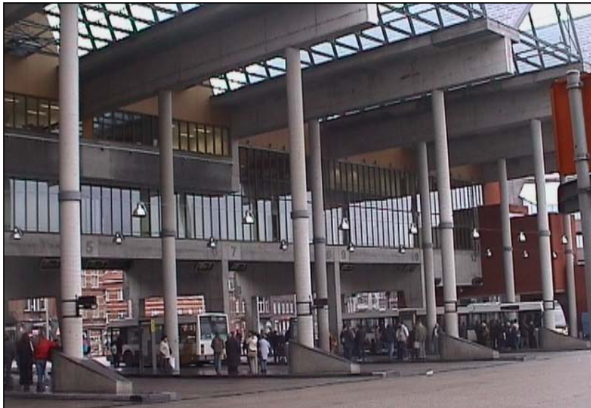
Gare de Leuven : couverture totale des quais De Lijn