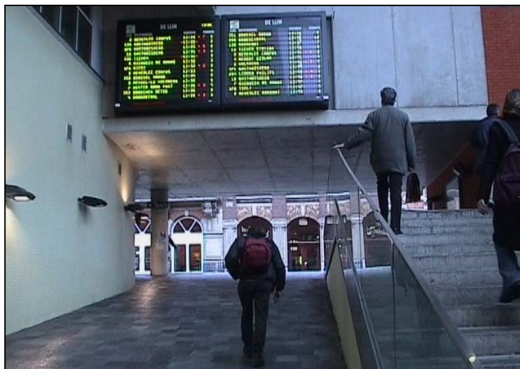
Gare de Leuven : couloir sous-voies. On remarquera le plan incliné menant aux quais De Lijn et le panneau indiquant les prochains départs de bus.

Si les parcours impliquent des dénivellations, elles seront rattachées, suivant leur importance, par des plans faiblement inclinés ou des moyens mécaniques. Les escaliers fixes ne sont considérés que comme des moyens de dépannage ou de sécurité. Dans tous les cas, l'accès sera rendu possible aux personnes à mobilité réduite (et donc aux landaus, vélos conduits en main et valises sur roue).