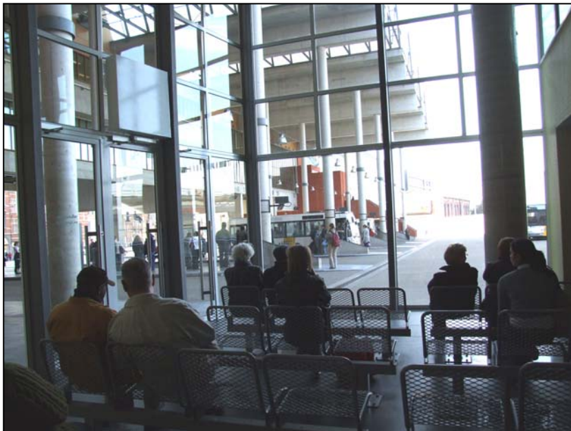
Gare de Leuven : salle d'attente De Lijn.

Sur les quais, les voyageurs en attente doivent être sous couvert et protégés du vent et des intempéries par des cloisons judicieusement disposées et assurant une visibilité des véhicules en approche. Des sièges doivent être à leur disposition. On trouvera un local fermé et pourvu de sièges dans le voisinage immédiat des points d'embarquement. Si le nombre de voyageurs le justifie, ce local doit être chauffé. Le voyageur doit y trouver toutes les informations nécessaires à la poursuite de son voyage ainsi que des distributeurs automatiques de titres de transport et d'en-cas. Les distributeurs de titres doivent être d'un modèle pratique d'emploi, acceptant monnaie et cartes de paiement.