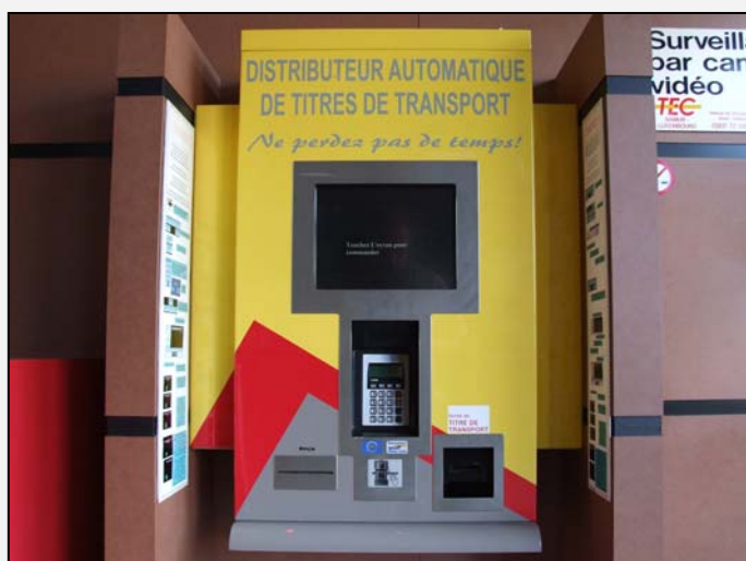
Ce distributeur automatique de titres de transport permet à la clientèle de gagner un temps précieux. Son utilisation est facilitée par un mode d'emploi clair et détaillé mais il n'accepte pas la monnaie ni les cartes de crédit.