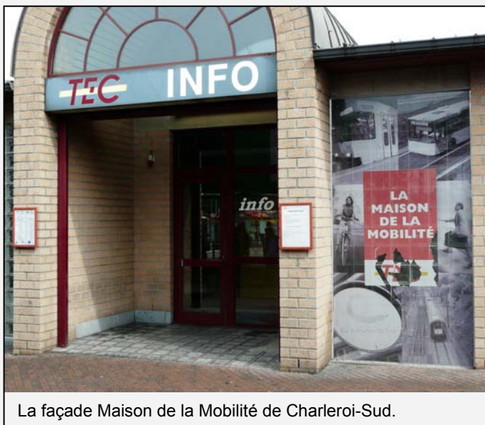
La façade Maison de la Mobilité de Charleroi-Sud.

Au-delà du nouveau look, l'habillage de l'infrastructure vient renforcer la volonté du TEC de renseigner la clientèle sur l'ensemble des produits alternatifs à la voiture individuelle (voiture partagée, tickets combinés trains-bus,...). L'ancienne mention TEC Info est cependant toujours présente en devanture. Le bâtiment est difficilement identifiable par les voyageurs étrangers. Une mention compréhensible par tous, du style « Bus Info » comme à Namur, serait la bienvenue.