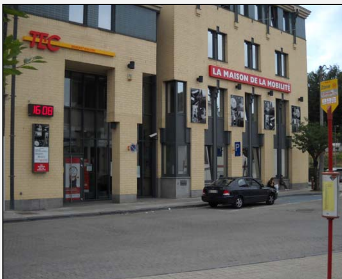
Le siège social du TEC Brabant wallon, situé place Henri Berger à Wavre, a subi un lifting complet et présente désormais une identité visuelle qui traduit le rôle de Manager de la Mobilité du TEC.

Comme à Namur et conformément au contrat de gestion 2006-2010, l'identité visuelle de la Maison de la Mobilité intègre l'élargissement du champ des informations disponibles par rapport à l'ancienne Maison du TEC. On regrettera toutefois les seules mentions « TEC » et « La Maison de la Mobilité » qui ne sont pas compréhensibles pour les visiteurs étrangers.