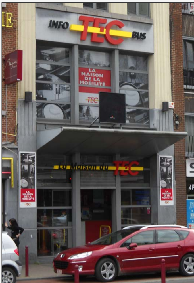
Située juste en face de la gare SNCB, la Maison de la Mobilité de Namur est facilement identifiable.

L'identité visuelle de la Maison de la Mobilité namuroise est bonne. Elle intègre l'élargissement du champ des informations disponibles (SNCB, Cambio, vélos, ...) et la mention « info bus » présente l'avantage d'être compréhensible par les voyageurs étrangers.