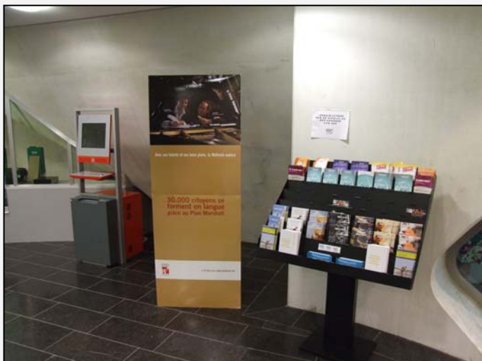
A droite des guichets, la clientèle dispose d'une borne de connexion et de quelques prospectus.