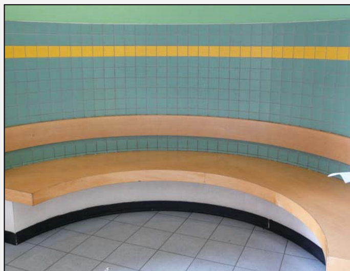
La Maison de la Mobilité de Charleroi-Sud est la seule des quatre que nous avons visité à disposer d'une petite salle d'attente.

Malgré un accès de plain-pied depuis la voirie, les PMR ne peuvent accéder aux guichets en toute autonomie : la porte d'entrée manuelle est fermée en permanence (idem à Liège-Guillemins et à Wavre) et l'endroit est dépourvu d'un comptoir surbaissé pouvant accueillir les chaisards (idem à Namur et à Wavre).