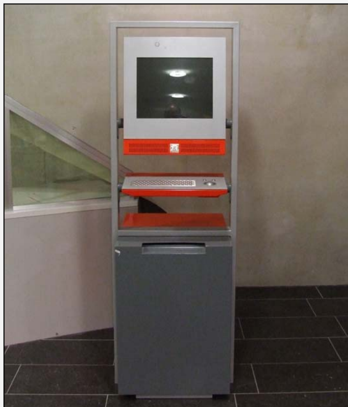
La borne de connexion qui doit permettre aux voyageurs de consulter le site infotec ou d'autres sites de transporteurs (SNCB, Railtime, Stib, ...) ne fonctionne pas.

Pour l'information dispensée aux guichets ou par téléphone : voir enquête client mystère.