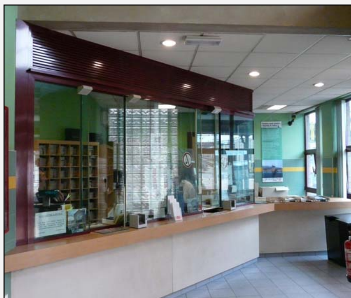
Comme à Liège-Guillemins et à Wavre, les guichets vitrés ne facilite pas le contact. Dommage pour un espace dédié en partie à l'information.