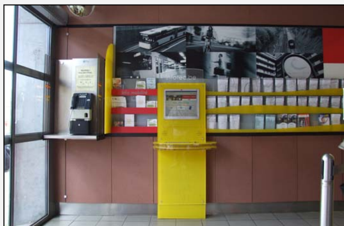
A gauche de l'entrée, une cabine téléphonique, une borne interactive et divers dépliants sont à disposition du public.

Les guichets ne sont pas vitrés, ce qui autorise un contact direct avec le personnel. Le confort d'attente laisse par contre à désirer puisqu'aucun siège n'est mis à disposition des visiteurs qui sont contraints d'attendre leur tour debout dans la file d'attente (pas de distributeur de tickets d'attente).