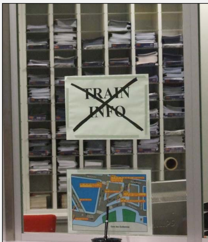
La Maison de la Mobilité de Liège-Guillemins ne fournit aucune information sur les trains. Etonnant de la part du TEC qui en tant que Manager de la Mobilité, est censé offrir une information porte-à-porte incluant tout les modes alternatifs à la voiture.